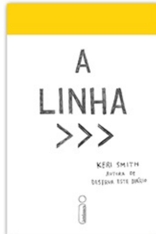
A linha Keri Smith