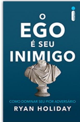
O ego é seu inimigo Ryan Holiday